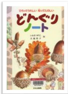
『どんぐりノート』 いわさゆうこ おおたき れいこ さく 作 ぶんかしゅつばんきょく 文化出版局