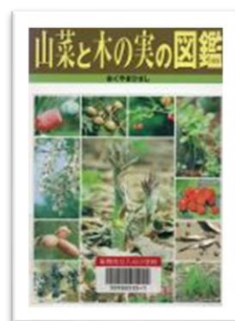
『山菜と木の実の図鑑』 おくやまひさし 作 ポプラ社