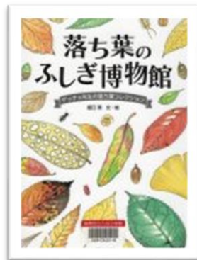
『落ち葉のふしぎ博物館』 もりぐち みつる ばん え 絵 しょうねんしゃしんしんぶんしゃ 少年写真新聞社