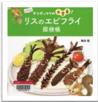
『マツボックリの大変身！ リスのエビフライ探検帳』 飯田 猛 作 技術評論社