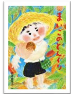
『まいごのどんぐり』 まつなり まり こ さく 作 どうしんしゃ 童心社