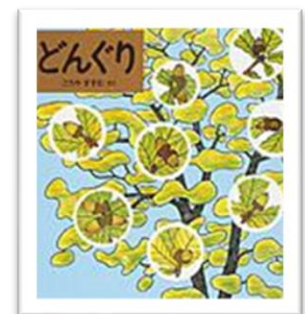
『どんぐり』 こうやすすむ さく 作 ふくいんかんしよてん 福音館書店