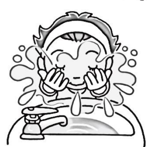
外から帰ったら、うがいや洗顔をする