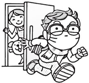
出かけるときはマスクや眼鏡をつける