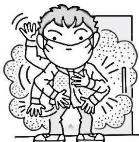
玄関の前で花粉を払い落とす