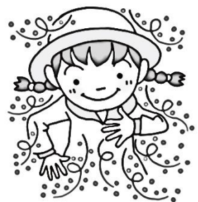
ツルツルした素材の服を着る