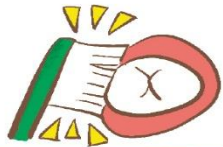
歯ブラシの毛先を 歯の面にあてる