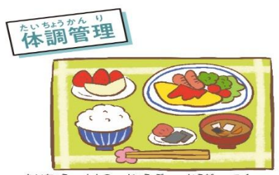
体調を整え丈夫な体を作ろう