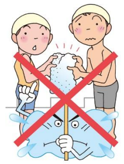
タオルをかりない