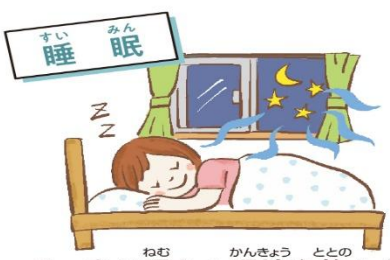
ぐっすり眠れる環境を整えよう