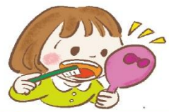
鏡を見ながらみがいて、 みがき残しをチェックする