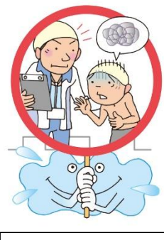
体調が悪くなった ら、先生に言う。