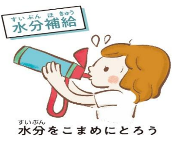
水分をこまめにとろう

5月は熱中症シーズンの始まり。急に暑い日が出てきて、暑さに慣れていない体がついていけず、熱中症になりやすい時期です。暑さに負けない体づくりをはじめましょう！