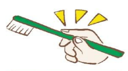
軽い力で えんぴつ持ち

せっかく毎日歯みがきをしても正しいみがき方ができていないと、みがき残しが多くなって口の中でむし菌が増えてしまいます。次の4つを意識してみましょう。